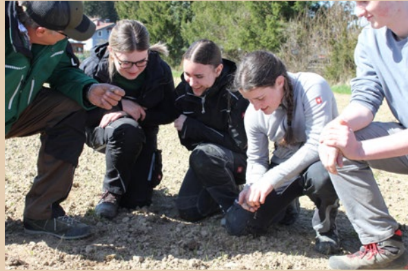
Die HBLA Ursprung war mit ihrem Lehrbetrieb ein wesentlicher Baustein des Projekts. Auch 2026 wird auf ihren Feldern wieder Braugerste angebaut.

Im September konnte die erste Braugerste geerntet werden.